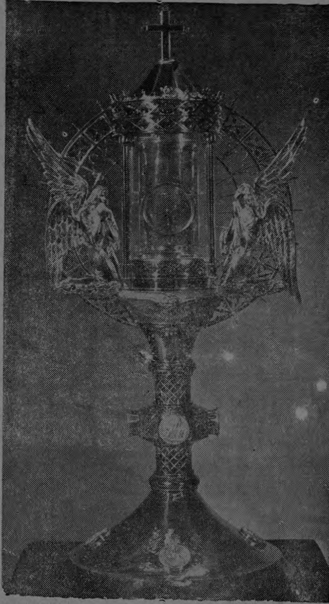
Creación en oro enchapado para una escuela de New Milford, Connecticut.